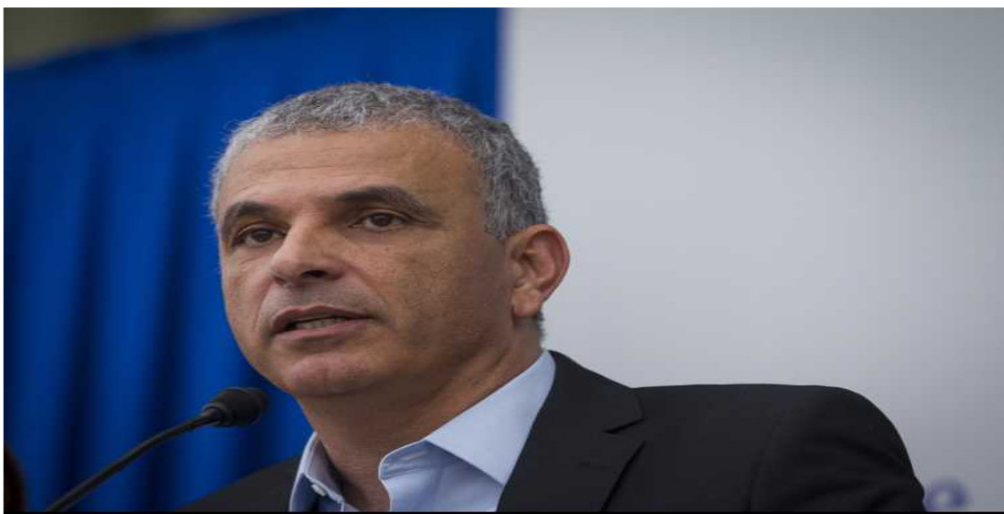
משה כחלון.